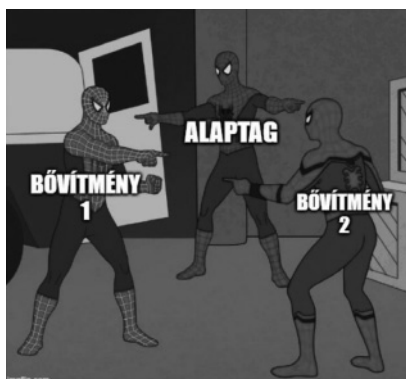
2. kép. Mém a szintagmabokor tanításához (György Ivett alkotása)

A mémek az összetett mondatok elemzésénél példaanyagként jelentek meg. Az utalószó-kötőszó mechanikus megkeresését ellensúlyozta az ezekben az alkotásokban megjelent humor, ahogy azt az alábbi (3.) képen látható példák is mutatják: